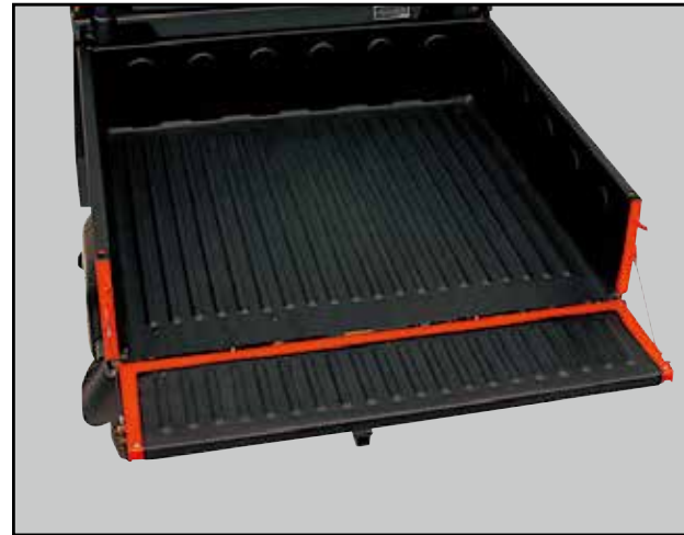
■ Protection de la Bennette