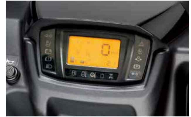
Tableau de bord avec affichage numérique

La servodirection hydrostatique réactive vous garantit un maximum de contrôle sans effort pour affronter n'importe quel terrain. Le volant s'ajuste en inclinaison, pour permettre à chacun d'effectuer ses réglages en fonction de sa morphologie.