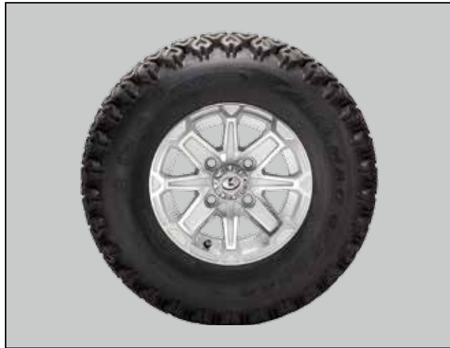
■ Jantes en aluminium